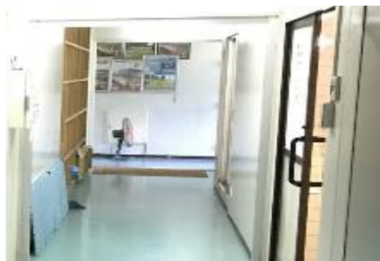
脱衣所（奥にサーキュレーター）