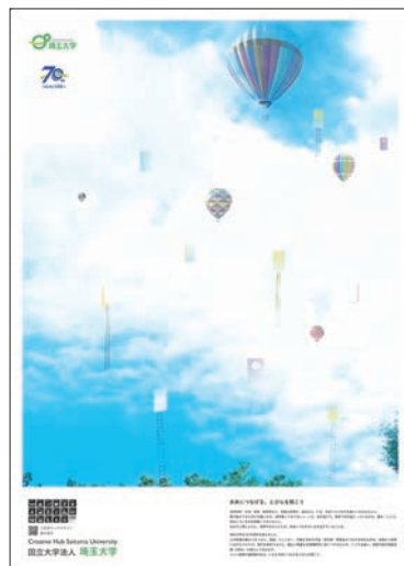
▲ポスターイメージ:未来につなげる、とびらを開こう

2015年から始まったJR埼京線と埼玉大学のコラボレーションポスターが、今年も大宮駅のデジタルサイネージや埼京線各駅で掲示されました。JR東日本大宮支社と埼玉大学は、埼玉大学周辺地域の魅力づくりや、埼玉県を中心としたJR東日本沿線の活性化、次世代の地域づくりを担う人材育成に向けた包括的連携協定を締結しています。このポスターは、その取り組みのひとつとして、地域を盛り上げようと、「未来につなげる、とびらを開こう」というテーマで作成されたものです。