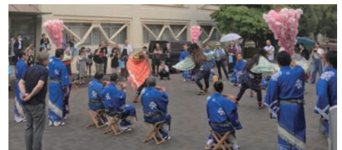
▲Lion Danceのデモンストレーション

第4回は「Asian Lion Dances—Performance and Participation アジア諸国の獅子舞—演技と参与」と題し、アジア諸国における獅子舞の紹介やディスカッション、Lion Danceのデモンストレーションを行いました。