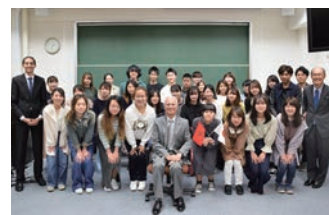
▲プフラル大使を囲んで