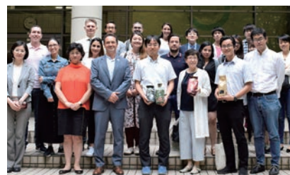
▲コロンビアからの訪問団との記念撮影

また、4月には同プランの一環であり、主にアジアからの優秀な高校生を1週間日本に招く「さくらサイエンス・ハイスクールプログラム」で来日したベトナム・スリランカの高校生計40名、引率教員計7名の合計47名を受け入れもっています。