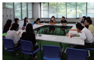
▲ランチミーティングの様子