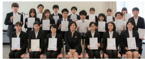
▲2019年度「埼玉わっしょい大使」に任命された各大学の 学生と牧千瑞 埼玉県農林部長(前列中央)

食店の情報など の写真を投稿し、 若者目線からの 県産農産物の魅 力を発信してい きます。