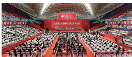
▲大連理工大学70周年記念式典

大連理工大学は、埼玉大学が連携協定を締結した大学の中で2番目に古く、現在も毎年、交換留学生を受け入れています。今後、埼玉大学と大連理工大学との連携がより強くなることが期待されます。