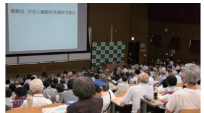
▲熱気あふれる会場の様子