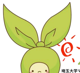
埼玉大学マスコットキャラクター メリンちゃん

メールで coic-jimu@ml.saitama-u.ac.jp あてに必要事項を記入の上 お申込みください。