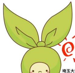
埼玉大学マスコットキャラクター メリンちゃん

メールで coic-jimu@ml.saitama-u.ac.jpあてに必要事項を記入の上 お申込みください。