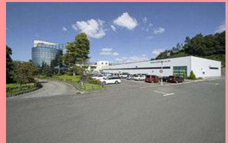
飯野工場（福島市飯野町）